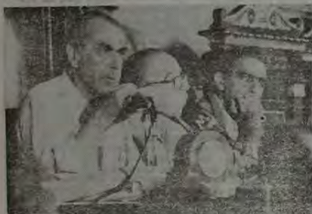
A experiência política de Brizola se impôs numa atitude de bom senso que resultou no contorno da crise do PDT, que teve no outro extremo o prefeito do Rio, Saturnino Braga. (Foto arquivo).

Os parlamentares do partido, tanto em nível da Câmara, como da Assembleia Legislativa e do Congresso Constituinte, também tiveram papel importante nos momentos em que estiveram em cena, e mesmo por trás dos bastidores. Foram precisas diversas reuniões entre Saturnino e os políticos para que se chegasse a um consenso. Quem ficou frustrado com a falta do racha foi o PMDB, que através do governador Moreira Franco, havia formalizado um convite a Saturnino para que ingressasse no partido. Ainda não foi dessa vez.