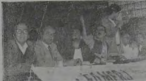
O encontro entre os candidatos ao Governo do Estado do Rio...