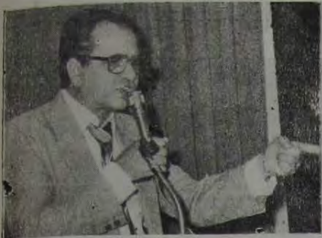
Bento Gonçalves, líder do PMDB na Câmara