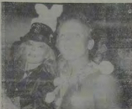
O colunista, com Ursula Andress, no carnaval 83