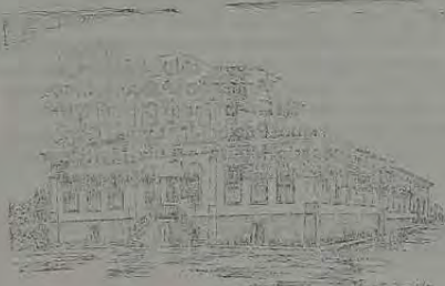
Fazenda São Bernardino - Cava - Nova Iguaçu