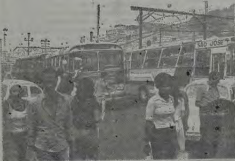
O problema do trânsito em Nova Iguaçu continua desafiando o bom senso das autoridades responsáveis pelo setor. A última alteração, por exemplo, determinada pela reativação do Terminal da Coderte, conseguiu o milagre de descontentar toda a população.