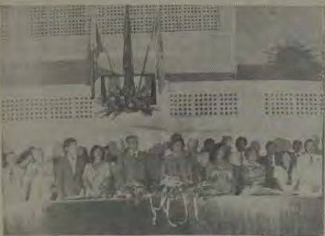
Mesa que presidiu a solenidade das professorandas.