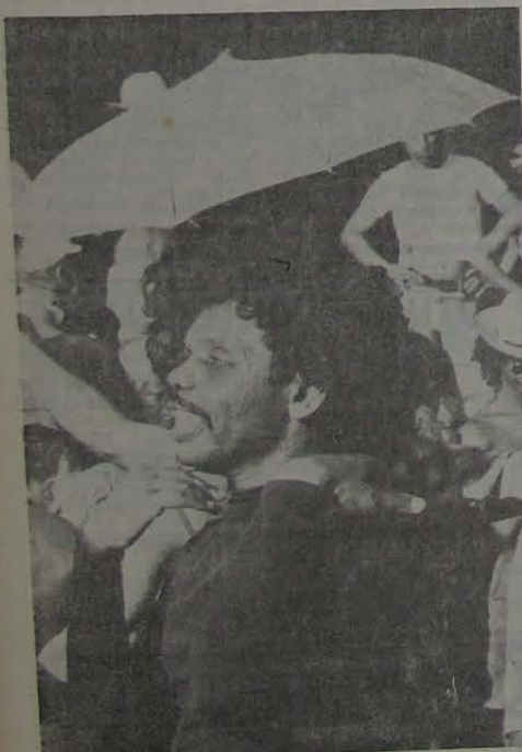
De ano para ano, o Carnaval em Nova Iguaçu vai perdendo a sua razão de ser, pela violência, em parte, e pela pornografia generalizada.

Tipografia São Sebastião Rua Sebastião... 2-7377