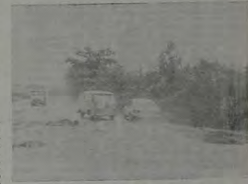
Os imensos buracos no asfalto quase não deixam espaço para os carros que voita e meia se chocam, na obra civilminosa da Av. Guandu (foto Gilberto Barra, especial para o CL).