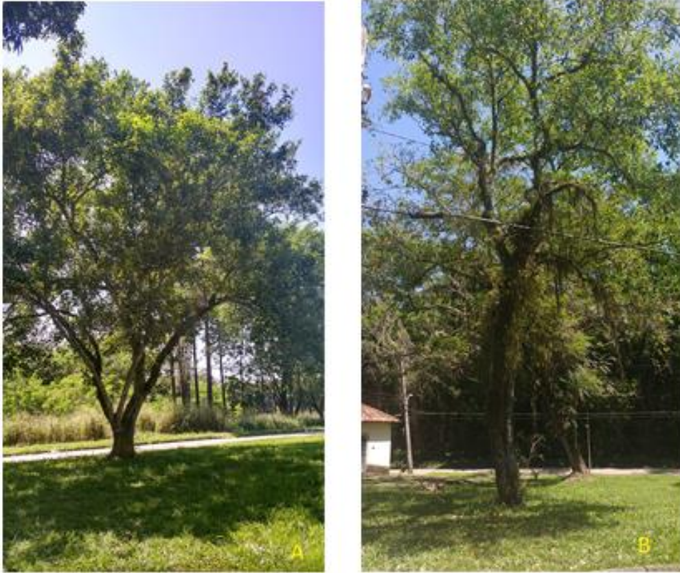
Figura 6: C. fairchildiana - estado geral ótimo (A) e estado geral bom (B).