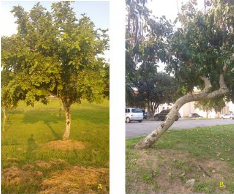
Figura 8: C. fistula - estado geral ótimo (A) e estado geral péssimo (B).