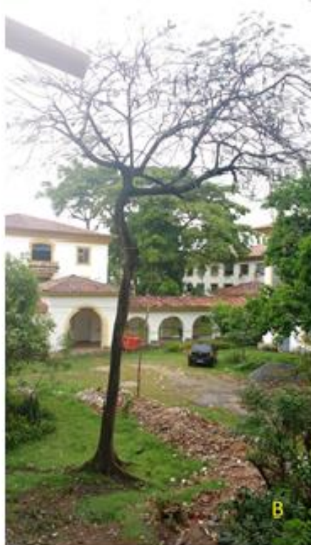
Figura 3: C. fairchildiana – sombreiro (A) e D. regia – flamboyant (B), com estado geral bom.