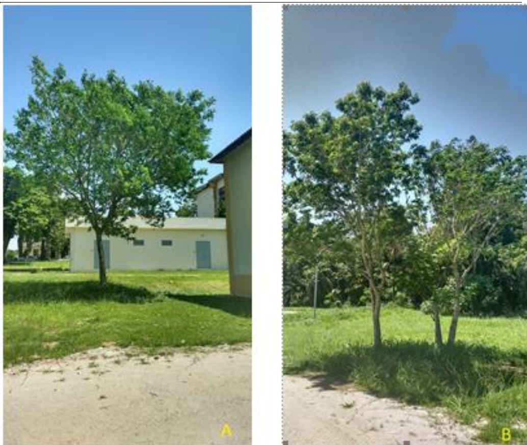
Figura 10: A. lebbbeck - estado geral ótimo (A) e estado geral bom (B).