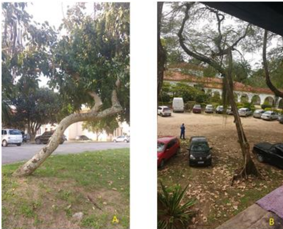
Figura 5: C. fistula – chuva de ouro (A) e D. regia – flamboyant, estado geral péssimo.