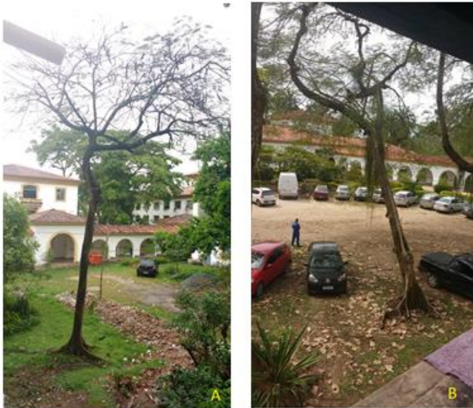
Figura 9: D. regia - estado geral bom (A) e estado geral péssimo (B).