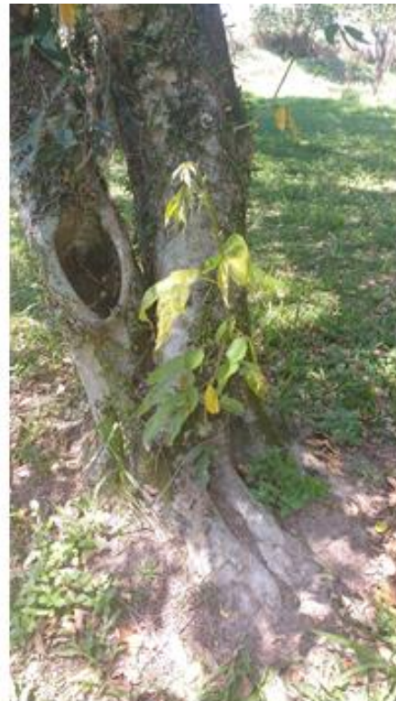
Figura 4: C. fairchildiana – Sombreiro, com estado geral regular (Necessidade de dendrocirurgia ou remoção da bifurcação).