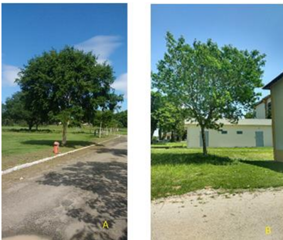
Figura 2: L. ferrea – pau ferro (A) e A. lebeck – albizia (B), com estado geral ótimo.