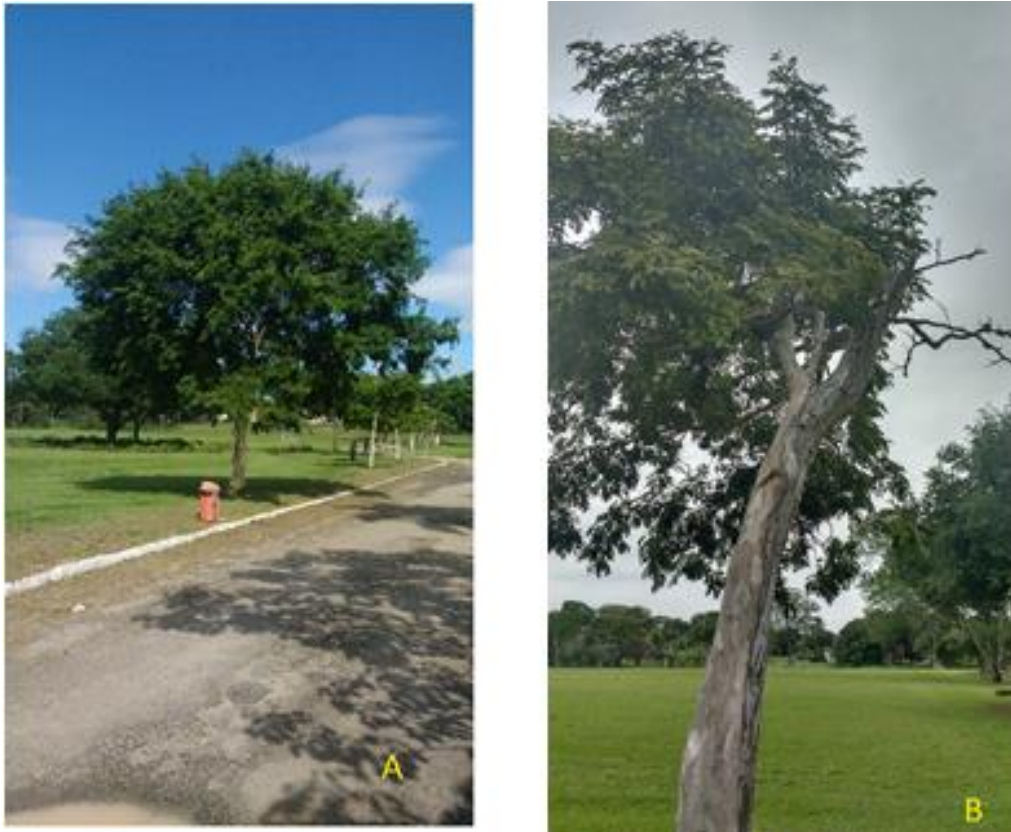
Figura 7: L. ferrea - estado geral ótimo(A) e estado geral péssimo (B).