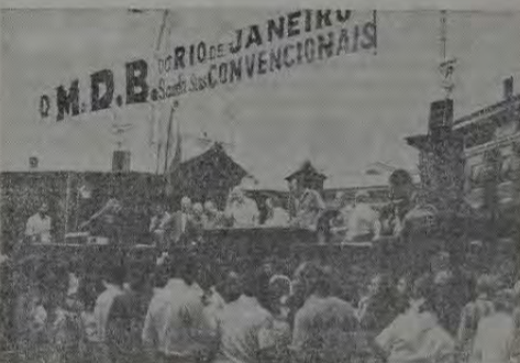
Flagrante da mesa que presidiu a Convenção do MDB.