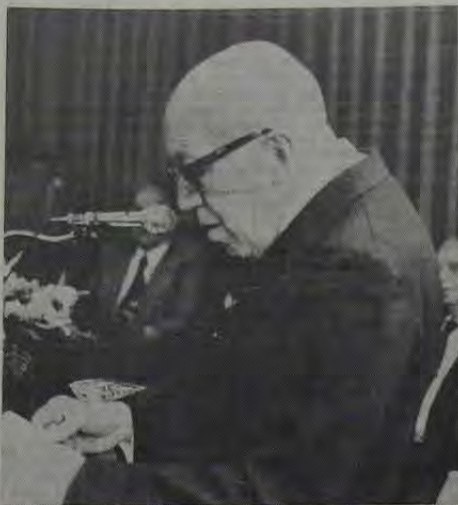
O Senador Magalhães Pinto ao discursar no plenário da Câmara Municipal de Nova Iguaçu, na solenidade do último dia 14 (segunda-feira), quando recebeu daquela Casa Legislativa o título de Cidadão Iguaçuano.

Concluindo, o Deputado José Maurício se solidarizou com a classe mais uma vez prejudicada em seu direito pelo "despreparado governante".