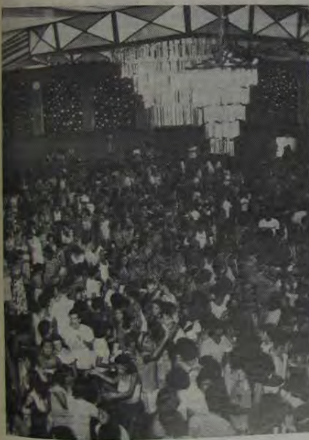
Mesmo sem revelar o mesmo brilho e animação de anos anteriores, o carnaval do Espírito Clube Iguaçu ainda permanece como um dos melhores de toda a Baixada Fluminense...