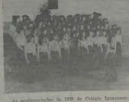
As professorandas de 1976 do Colégio Iguaçuano.