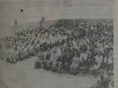
Flagrante da assistência na solenidade de formatura do Conesal.

Com a despesa fixada em bases iguais à receita, o Projeto de Lei n.º 684-A, de 1976, prevê a movimentação de verba igual a vinte e três bilhões, quinhentos e quarenta e sete milhões, duzentos e cinquenta e oito mil e trezentos e dezessete cruzeiros. Esse projeto foi publicado no suplemento especial do Diário Oficial de 25 de novembro de 1976.