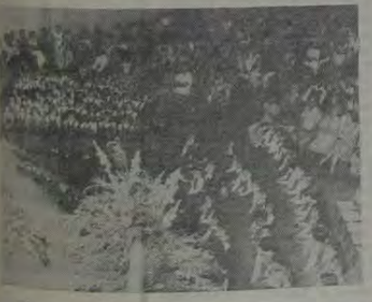
Formatura do Jardim de Infância