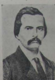
cional e oficial da secretaria do Ministério da Fazenda".

A importância de Manuel Antônio de Almeida na literatura brasileira "não decorre de sua produção dispersa pela imprensa, mas do romance "Memórias de um Sargento de Milícias", estampado no "Correio Mercantil", entre 1852 e 1853, sem nome de autor, e lançado em 2 volumes, de 1854 a 1855, assinado por "Um Brasileiro" a que se seguiram mais de uma dezena de edições. Este número de edições, aliás, prova o êxito da obra de Manuel Antônio de Almeida, "embora a crítica só muito mais tarde, graças sobretudo aos modernistas, viesse a reconhecer o valor do livro, hoje considerado um dos pontos altos do romance brasileiro".