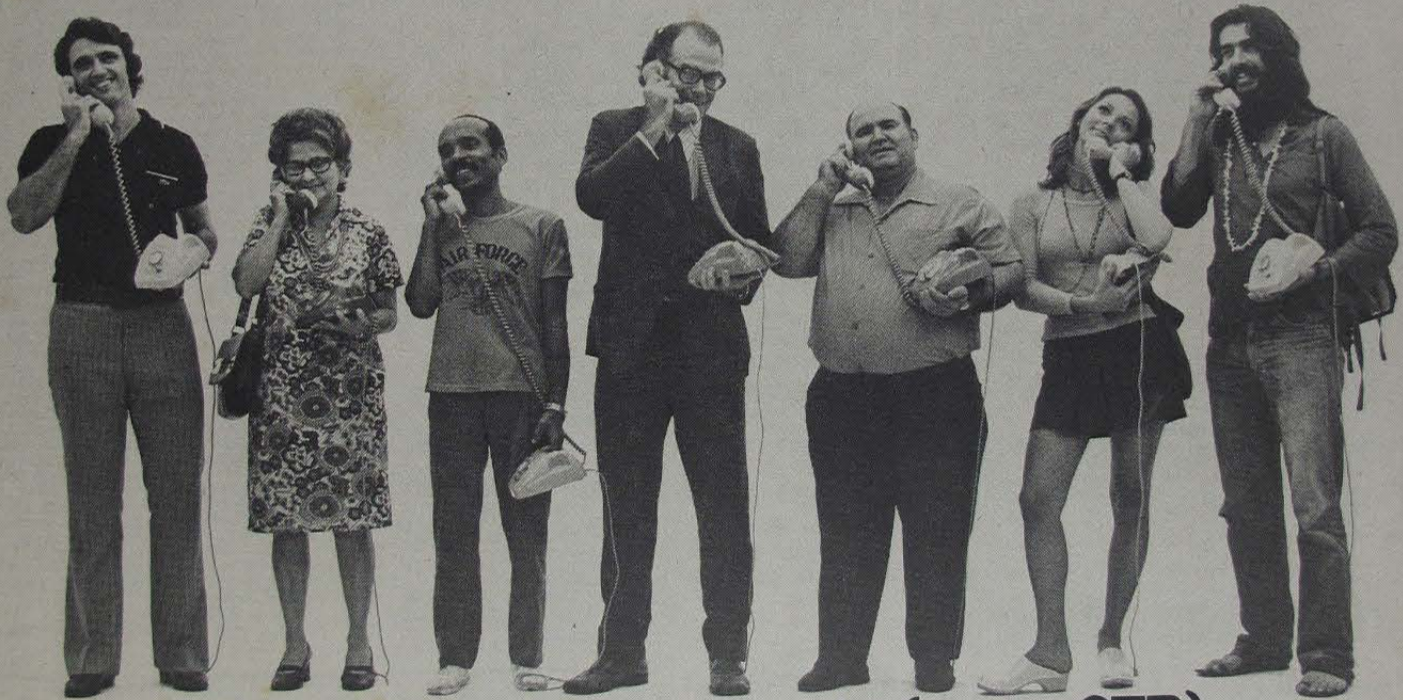
A Baixada Fluminense, amanhã (com a CTB).

Este amanhã já está começando. Se você mora em Duque de Caxias, Nova Iguaçu, Nilópolis, São João de Meriti, Belfort Roxo, Vilar dos Teles ou Mesquita, vai poder dentro de poucos dias reservar um ou mais telefones para sua casa, loja ou escritório. Em lugar dos escassos 6.900 telefones de hoje, a Baixada Fluminense vai ter em breve 46.800. Ou seja: 7 vezes mais. Para isto, já assumimos o controle acionário das