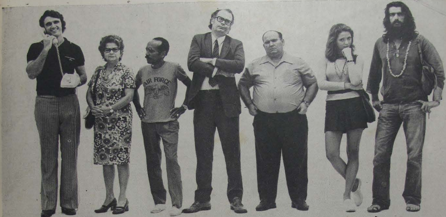
A Baixada Fluminense, hoje (sem a CTB).