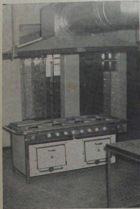
Em todas as dependências do Centro de Formação de Líderes, observa-se um apuro inigualável, tanto no acabamento do prédio como na qualidade da aparelhagem instalada.

tro quer dar uma contribuição às estruturas sociais, da Igreja, da comunidade, do Estado, na esperança de construir um mundo melhor, um pouquinho melhor. O Centro quer formar adultos, isto é: conscientizá-los, motivá-los, para assumirem em espírito cristão as suas responsabilidades.