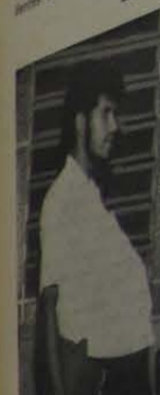
Cena de um ensaio, pela equipe de teatro do Colégio Gonçalves Dias.