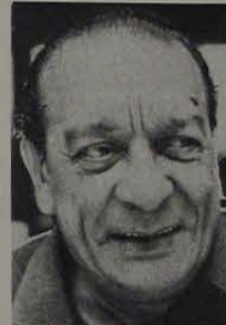
3) A morte continuando sua ronda colheu outra importante figura dos meios artísticos — Ciro Monteiro. Perda irreparável para a música popular que contava com Ciro entre seus maiores representantes — não somente como cantor mas também como compositor.