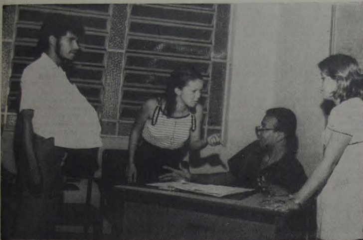
Cena de um ensaio, pela equipe teatral do Instituto Brasil, da comédia "Quando as pilulas falham"

enviará o maior número de atletas para Brasília, na disputa dos Jogos Estudantis Brasileiros. Disse ainda que está treinando os seus atletas em corridas de fundo (15 quilômetros) como par-