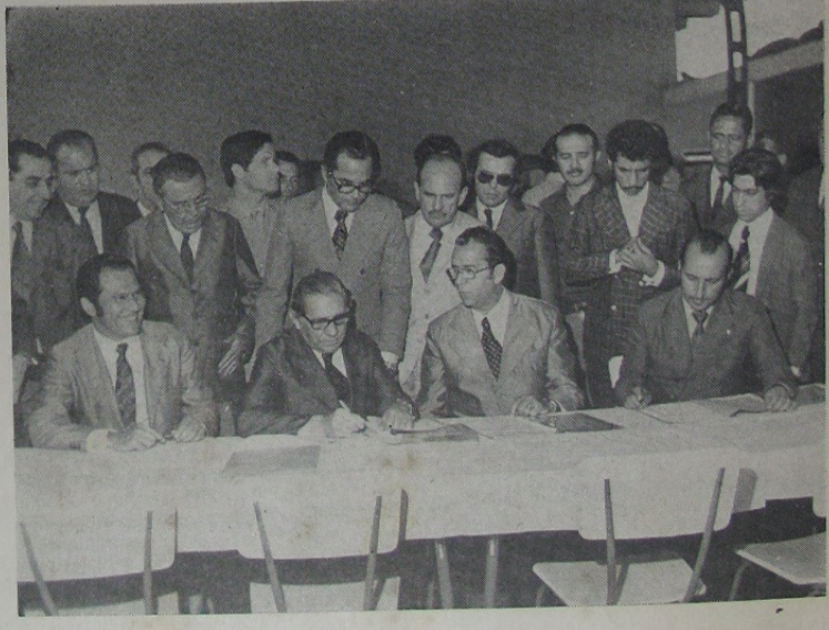
Flagrante da assinatura do convênio.

A Prefeitura de Nova Iguaçu já tem programado o calçamento de dezenas de avenidas e ruas que entrarão na linha prioritária de obras asfálticas.