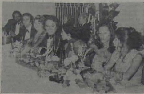
Mesa da diretoria do Nova Iguaçu Country Club, no Baile das Debutantes.