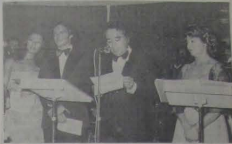
Ocasão em que o Presidente Wislaine pronunciava a saudação às Debutantes do Nova Iguaçu Country Club. (Foto de Antonio Poças).