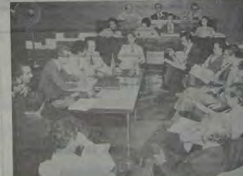
Flagrante do V Encontro de Juizes Eleitorais realizado no Salão do Juri do Fórum Itabaiana.