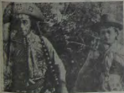
Lampião e Maria Bonita, personagens imortalizados pela Literatura de Cordel

Sem deixar o nosso Exército se recolher para os quartéis os corruptos e malfiteiros na meto dos bacharéis cometem crimes impunes como fizeram os infelís".