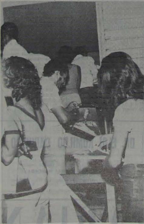
A maleta tipo James Bond esconde mil títulos que o vereador mantém em seu poder. Da retenção ao máximo desse documento, até o dia 15 de novembro, ele depende para garantir a sua reeleição.

No entanto, a SUCAN procedeu o expurgo (com BHC a 30%) tendo-se observado sensível baixa na densidade daquele triatomíneo, sendo que em diversas casas constatou-se a sua erradicação. (C. Balthazar da Silveira)"