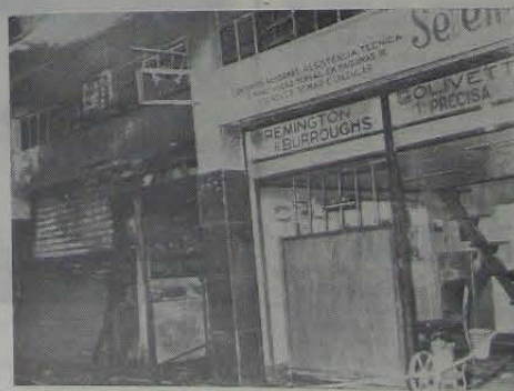
A loja da SETEMIL, à esquerda, ficou bastante danificada a com o incêndio.

Nossa reportagem conseguiu apurar que a SETEMIL está segurada em Cr$ 40 mil, importância esta que não cobrirá os prejuízos. A pericia esteve no local mas não constatou a causa do incêndio. Por fim, alguns soldados da Polícia Militar foram mobilizados para evitar que populares invadissem as lojas da casa danificada.