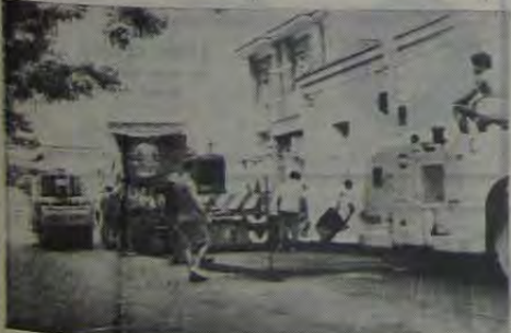
Os serviços (já concluídos) de asfaltamento da Rua Bernardino Mello foram concluídos em menos de 15 dias.

Fontes ligadas ao Governo Municipal revelaram ao CL que o Plano de Ação anunciado pelo Prefeito João Batista Barreto Lubanco já está sendo executado em diversos pontos do Município e do centro de Nova Iguaçu.