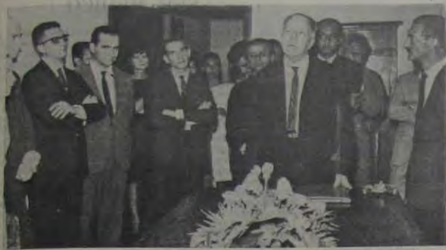
Mattoso Câmara discursa na inauguração do Instituto de Linguística e Fonoaudiologia da Universidade Federal de Pernambuco (UPE), em São Paulo.

A existência de uma atividade científica que tem como objeto a linguagem é, ainda hoje, frequentemente ignorada. O público conhece apenas duas espécies de atividades no campo da linguagem e das línguas. E, em primeiro lugar, uma atividade normativa, orientada para o conhecimento e o ensino da boa elocução, ditando regras em matéria de gramática, vocabulário e também de ortografia; a esse respeito, reina ainda um dogmatismo cego, baseado na autoridade da "regra" ou da "lógica", que desvia a atenção da realidade viva da língua. E, em segundo lugar, a aquisição de um número mais ou menos grande de línguas além da língua materna: — O políglotismo, cujo prestígio é geralmente considerável.