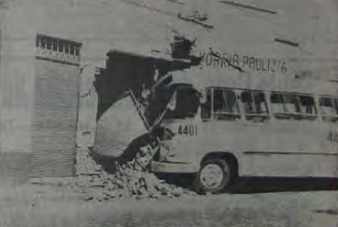
O choque do ônibus da Empresa N. S. da Conceição danificou parte da fachada da Carvoaria e da Auto Escola Santa Eliza.

Como havíamos previsto, aconteceu o inevitável. Há algum tempo vimos alertando as autoridades do trânsito em Nova Iguaçu para o perigoso tráfego de mão-dupla na Rua Bernardino Melo. Até agora, infelizmente, nenhuma medida corretiva e concreta foi tomada por nenhum órgão responsável pelo setor e os ônibus (muitos) continuam circulando em alta velocidade numa rua estreita e de calçadas também estreitas, principalmente no lado da via férrea. Por esses e por outros motivos que não vamos alinhar aqui, na Rua Bernardino Melo o pedestre e até mesmo os estabelecimentos comerciais e as casas de família correm sérios riscos. Enquanto as autoridades do trânsito em Nova Iguaçu não se decidirem a disciplinar o tráfego nesta importante via de circulação do centro da cidade, novos desastres ocorrerão de conseqüências, talvez, bem mais graves.