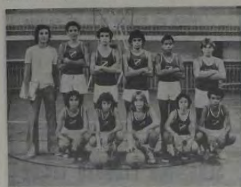
Na foto, a equipe juvenil do Iguaçu Basquete Clube

A equipe infantil e a de juvenil do Iguaçu Basquete Clube jogaram amistosamente no último sábado no Ginásio da Rua Arino de Oliveira. Na categoria infantil o IBC levou a melhor sobre o seu adversário, em partida bastante disputada tecnicamente. A equipe juvenil do IBC perdeu de 58 a 47 mas demonstrou muito espírito de luta.