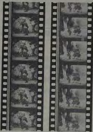
duas sequências de "Romance em Belem", desenho animado de Bertolotti e Siqueira, o trilho sonoro

Considerado a arte do Século XX, o cinema, atualmente, segue dois caminhos que configuram, por assim dizer, o impasse de seu pleno enquadramento no mundo. O seu desenvolvimento e, paralelamente, o próprio processo de evolução da fisionomia social, política e cultural do nosso tempo, colocaram-no entre duas formas de abordagem da problemática universal: a primeira seria pela alienação, ou seja, pela absoluta subordinação aos estereótipos determinados pela estrutura alienada-alienante do Estado. A segunda, a mais válida, seria optar por uma visão-do-mundo, tornar-se um instrumento da individualidade do artista e da avaliação crítica dos problemas da sociedade.