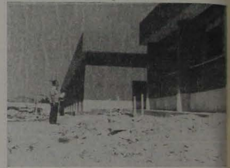
As obras do G.E. Jardim Marilice deverão estar concluídas no próximo mês de maio

O prazo para a conclusão das obras foi de 10 meses e o seu custo total chegou a Cr$ 1.600 mil.