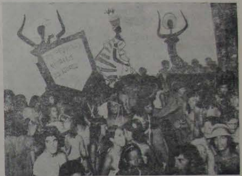
No tradicional Esporte Clube Iguaçu ainda se realiza o melhor Carnaval da Baixada Fluminense.

Passaram-se os dias da maior festa popular brasileira. Festa em que todo o povo se confraterniza em delírio alucinante, escapando das agruras acumuladas durante todo o ano. Não foi o melhor nem o pior Carnaval. Apenas mais um Carnaval. Cometeremos um grave erro se analisarmos o Carnaval sob um prisma saudosista. Carnaval, como qualquer outro fato social, se renova a cada instante. O que há, na realidade, são novas formas de fazer e de se ver o Carnaval. Muita gente anda dizendo por aí que o Carnaval está com os seus dias contados, simplesmente porque determinadas coisas que se faziam no Carnaval de antigamente não são feitas atualmente. Tudo se transforma. O Carnaval tem que se adaptar às novas realidades. Como tudo, enfim.