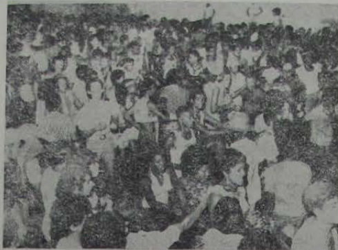
Um aspecto da multidão que superlotou a Praça Manuel Duarte durante os quatro dias de Carnaval.

PRAÇA — Com o seu coreto armado na Praça Manoel Duarte (por sinal, bastante elogiado pela população mesquitense), os foliões do 5.º Distrito brincaram durante os quatro dias dos festejos de Momo. Lá em Mesquita desfilaram os seguintes blocos: Águia de Prata, Bafo da Cobra, Bafo do Cabrito, Amizade do Banco de Areia, Os Machões, Vira-Vira, Chaparrinha Show, Unidos de Edson Passos e outros.