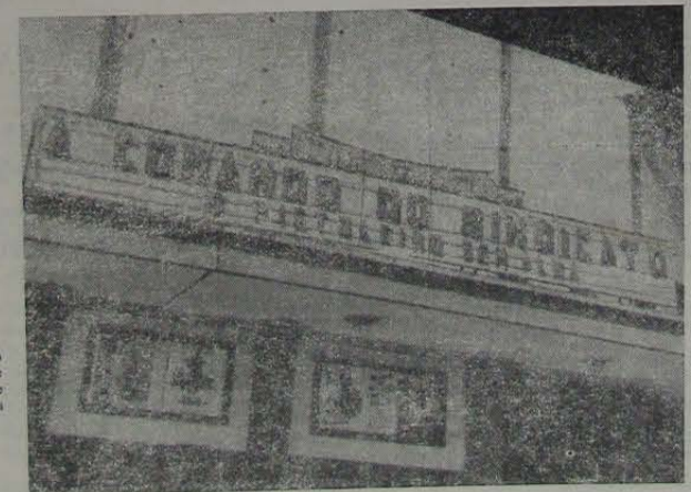
— Tá vendo só. Depois vocês dizem que não há mais movimento sindical no Brasil. Eis a mais recente deliberação. (Sérgio Fonseca)

NOVA IGUAÇU — MESQUITA (VIA BERNARDINO MELO). VERGONHA MUNICIPAL OU ESTADUAL?