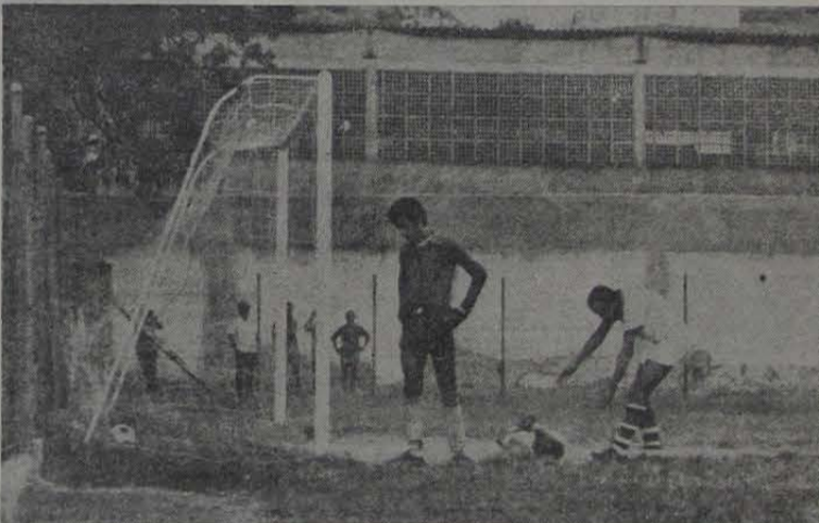
No flagrante o sensacional gol de Niterói, cabeceando a bola rente ao chão depois de um ótimo lançamento de Bené.

Amanhã, na partida do retorno, Nova Iguaçu receberá a visita da seleção de Cachoeira de Macacu. O encontro será realizado no Estádio Augusto Simões, onde a nossa equipe poderá se reabilitar do revés sofrido no primeiro jogo, lá em Cachoeira. Estamos certos de uma coisa: se Nova Iguaçu apresentar amanhã o mesmo padrão de jogo que apresentou domingo passado frente a Nilópolis, é quase certo que sairemos vitoriosos deste prêmio. Prestigiem a