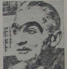
de Monteiro Lobato (foto). Todos os personagens do famoso sítio estão na tela: Emilia, Narizinho, Dona Bentita, o Visconde e todos os outros. A crítica diz que talvez não seja o filme que devemos a Lobato mas tem grandes instantes de beleza vividos no sítio do Picapau Amarelo, que hoje ainda pode ser visitado na localidade que viveu o fabuloso escritor —