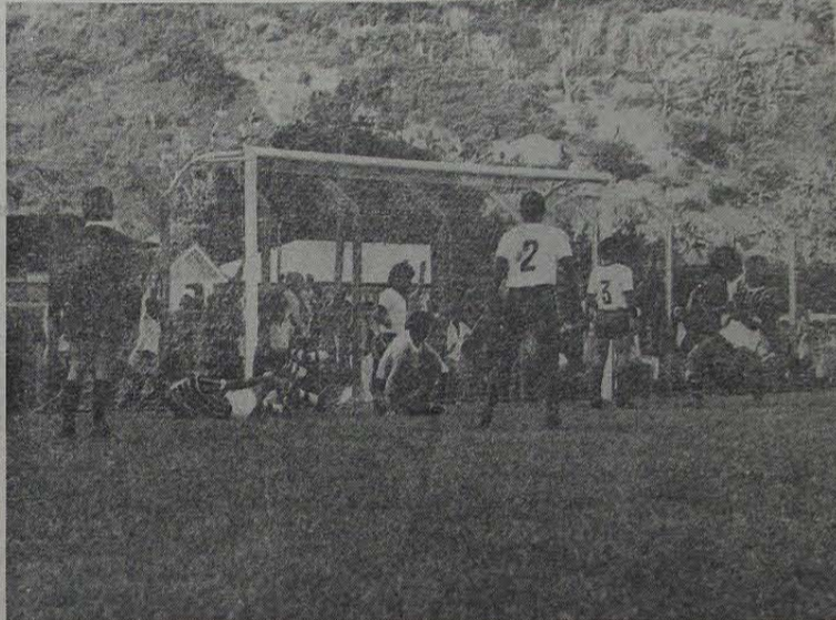
Em virtude da fragilidade do nosso adversário, somos obrigados a considerar que a nossa seleção perdeu, no jogo de domingo passado, um ponto precioso frente à equipe de Cachoeira de Macacu.