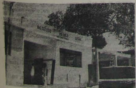
Inúmeras pessoas residentes nas proximidades do necrotério têm reclamado insistentemente do mau cheiro que em certos dias se verifica nas imediações.