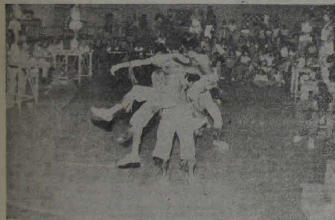
Tudo indica que brevemente teremos Roda de Samba e Ensaio Geral no Iguacu. Vi o Presidente e o Vice-Social no último dia 28, na "Casa Velha"...