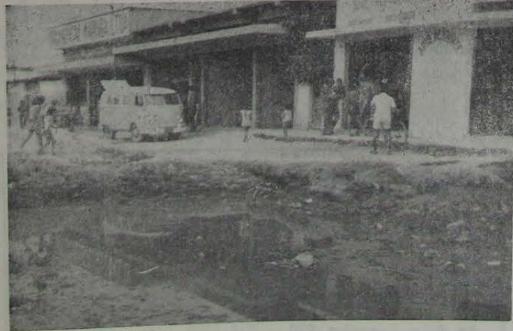
A paralisação das obras na Estrada Luiz Lemos vem provocando sérios prejuízos aos pequenos comerciantes.

O pior é que as crianças encontram em tais "lagos" um paraíso para as suas traquinagens, longe de saberem, na sua inocência, os perigos desse recreio em águas poluídas.