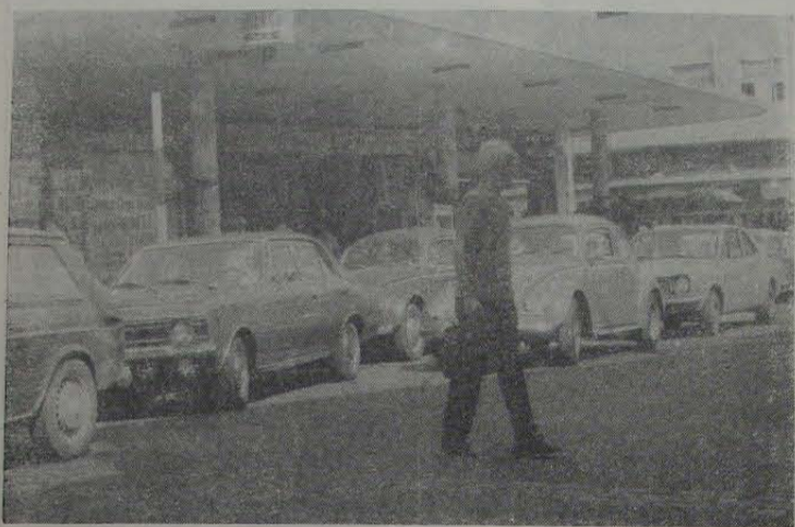
FILA DUPLA — A foto comprova o que temos afirmado nesta coluna. A Divisão de Trânsito é inoperante, deixando os motoristas desta cidade com profunda "neurose". Na Avenida Amaral Peixoto (lado ímpar) o estacionamento é PROIBIDO (?), segundo ficou decidido com a recente mudança, mas... como não existe uma fiscalização competente, o estacionamento já está sendo feito em fila dupla diante da antiga rodoviária, esquina de Otávio Tarquino.

APELO — Moradores da Avenida Irene pedem, por nosso intermédio (que os fiscais da Prefeitura têm uma olhada sobre o que anda ocorrendo num terreno baldio (pequeno) na Avenida Irene. Segundo as informações dadas a este colunista, o local transformou-se num verdadeiro microtúrio público. À noite é comum o encontro de casais no local, quando os moradores presenciavam cenas amorosas e são obrigados a ouvir palavras de baixo calão, além dos sussurros habituais de alcova. Em suma: o terreno nada mais é que um prostíbulo. E o que os moradores desejam, realmente, é que a Prefeitura, através do órgão competente, pressione os proprietários do tal terreno a construírem um muro para que essas cenas não mais aconteçam numa avenida exclusivamente residencial.