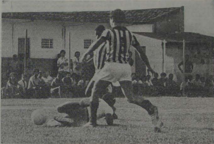
Sobre o jogo Mesquita x Heliópolis, o máximo que se pode dizer é que foi ruim.