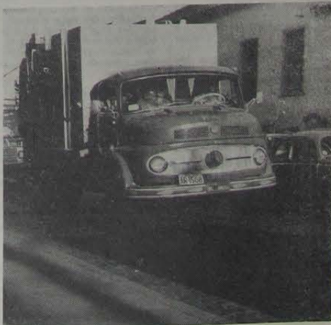
Os novos carros para o serviço de coleta domiciliar de lixo, adquiridos pela Prefeitura Municipal, desfilaram pelas ruas centrais da cidade.

Ao contrário de Nilópolis, que já esgotou seus depósitos, Nova Iguaçu não encontra problema para a colocação do lixo recolhido. O vazadouro do bairro de Santa Rita, foi entretanto abandonado por motivos de estética (ficava junto à estrada de acesso ao autódromo) e os detritos estão sendo atirados agora numa área de Queimados.