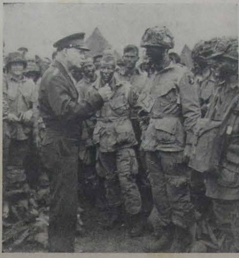
Eisenhower anima os paraquedistas