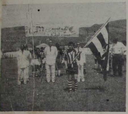
Em passado recente, o Torneio Início era o ponto alto da programação do Campeonato da Cidade.