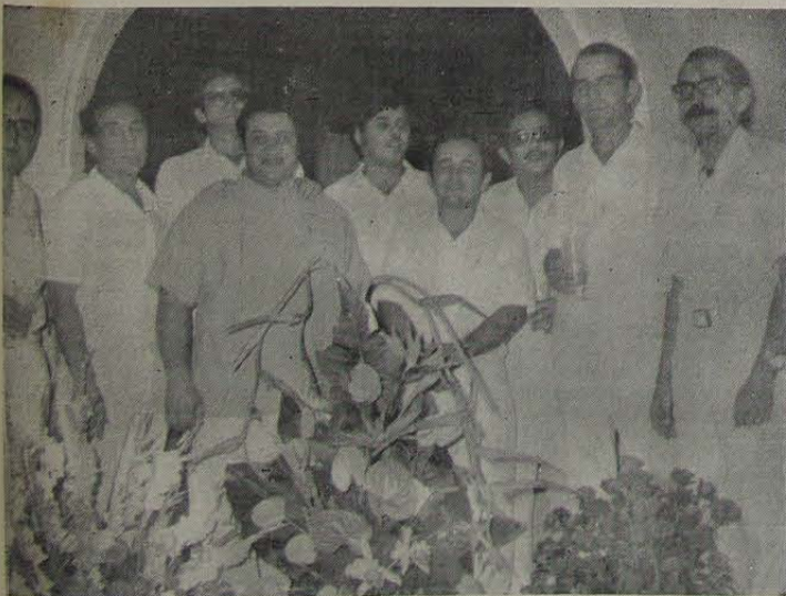
A equipe de médicos e diretores de CLINICOR