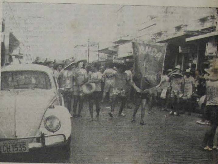
Este ano a Banda de Nova Iguaçu dividiu com o tradicional Bloco dos Chifrudos a animação do Carnaval de rua em nossa cidade.