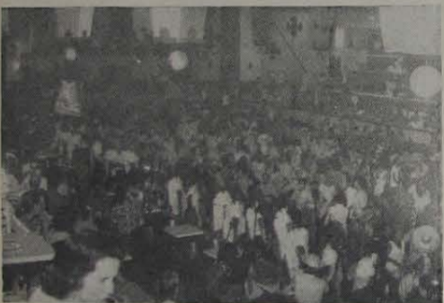
Como acontece todo ano, neste Carnaval o E. C. Iguaçu liderou os clubes em animação e freqüência.