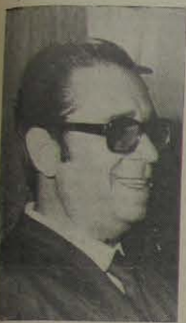
Em declarações à imprensa, terça-feira última, o

deputado Joaquim de Freitas (foto) — presidente da Assembléia Legislativa do Estado — reafirmou que em hipótese alguma abrirá mão de sua candidatura ao cargo de prefeito de Nova Iguaçu nas próximas eleições.