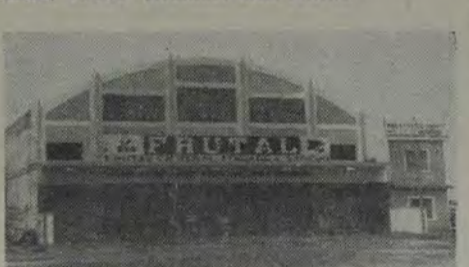
O pavilhão de frutas é grande marco de progresso de Nova Iguaçu.