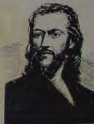
5 o trabalho de pesquisa intitulado: Tiradentes. O Martir de Vila Rica).

No próximo dia 21, terça-feira, o Brasil estará comemorando o 178.º aniversário de morte do alferes Joaquim José da Silva Xavier, o Martir da Independência. A projeção histórica do alferes de Vila Rica deixou-lhe a alcunha de O Tiradentes — líder da Inconfidência Mineira e o mais autêntico símbolo da nacionalidade na luta contra o colonialismo político e o conformismo social ainda vigentes. (Leia na página