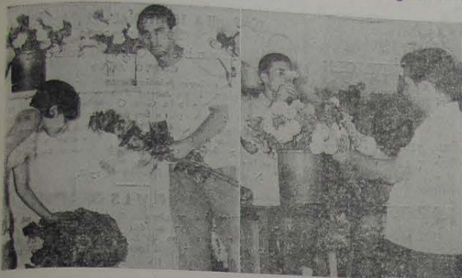
O cuidado e a presteza com que os dirigentes da firma atendem aos fregueses, atestam o prestígio de que goza "A Rosa de Iguassu" em nossa cidade.

Preferida pela sociedade iguassuana há mais de uma década, "A Rosa de Iguassu" já se tornou tradição em nossa cidade, fornecendo flores da melhor qualidade, bem assim confeccionando, com esmero e perfeição, coroas, bouquets de noivas, cestas, e ornamentações de igrejas, colégios, clubes, residências e banquetes, dos quais é especialista.