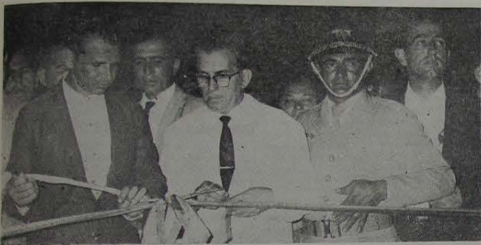
O governador Jeremias Fontes inaugura o viaduto juntamente com o prefeito Antônio Joaquim Machado.

dizendo mesmo que o Governador fora bastante feliz em dar ao viaduto o nome do querido sacerdote, que tanto amara Nova Iguaçu.