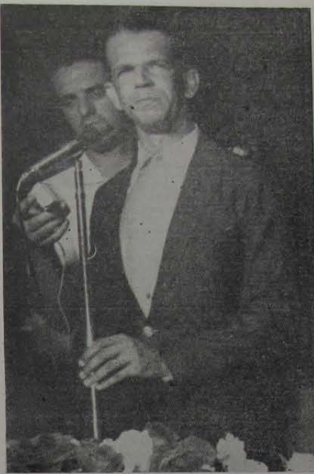
O governador Jeremias de Matos Fontes quando discursava durante o banquete no Country Club

Ouvindo fere reportagem, declarou o eng. Heródoto Bento de Melo, diretor do DER, que "o resultado obtido é fruto da seriedade com que vêm sendo encaradas todas as metas no atual Governo, onde tudo se faz dentro de planificações racionais que, se fogem à previsão, como no caso do viaduto, o fazem com vantagem para a população". Os técnicos — acrescentou — demonstraram critério na fiscalização da obra e também audácia e senso de zelo na escolha dos métodos de controle e planejamento, que recaiu no consagrado método "PERT". Através dele foi possível a coordenação de 57 atividades diversas, obtidas mediante replanejamentos. Na fase final, os diagramas "PERT" eram renovados, em média, cada 15 dias, ficando o controle das estimativas de tempo de duração das diversas atividades a cargo da equipe especializada do DER-RJ.