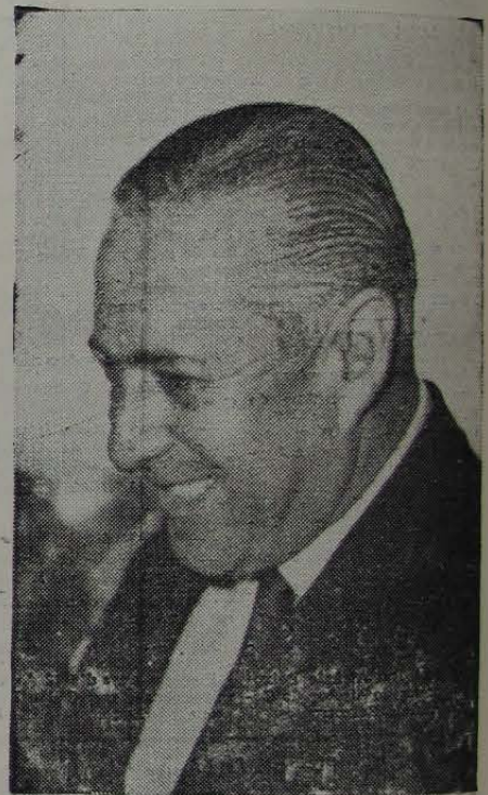
O HOMEM — Até onde irá o seu dinamismo?