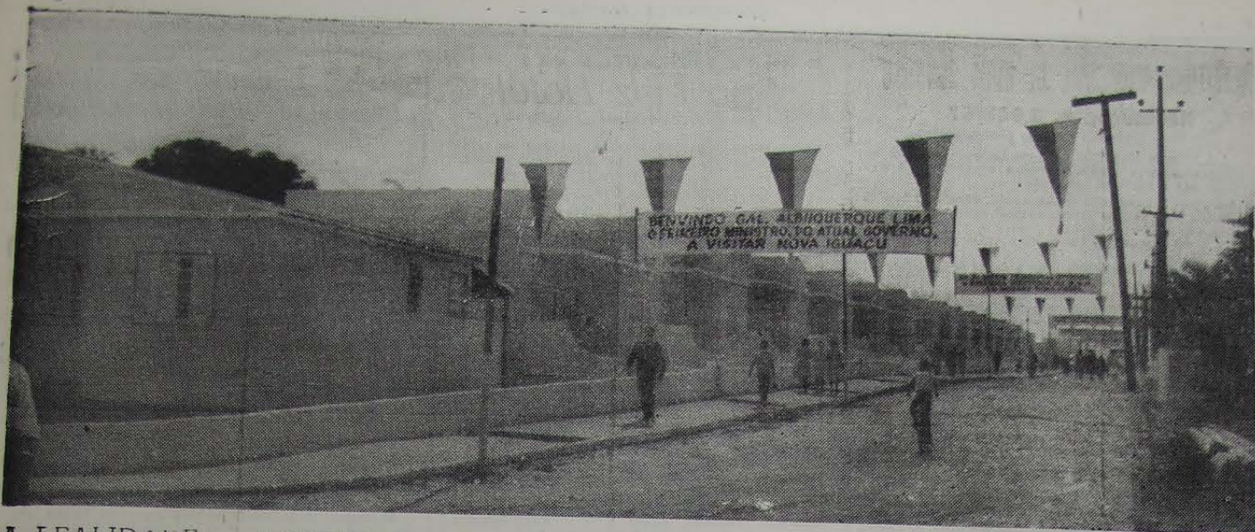
A REALIDADE ... A perspectiva que represent. o início da solução habitacional de nossa comunidade.