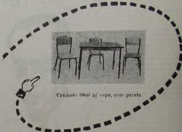
Conjunto ideal p/ copa, com gaveta

Vendas na Fábrica e nas Boas Casas do ramo