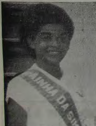
Rainha da Simpatia