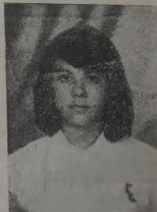
Bi-campeã da Maratona Intelectual MEDALHA DE OURO