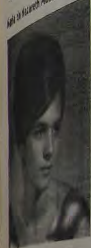
De Normal — 1º lugar MEDALHA DE OURO

Colégio Leopoldo VITAM 1º de Fevereiro Trinta e seis A maior do Estado