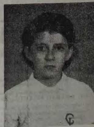
Miss Primário 4º ano A — 1º lugar