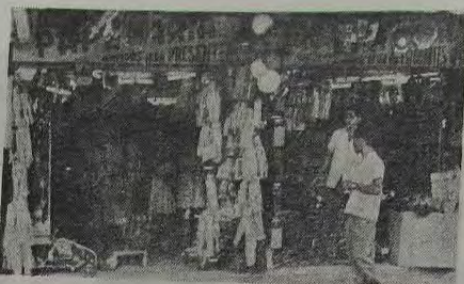
Papelaria Carla Rua Mal. Floriano, 2247