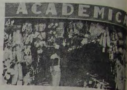
Papelaria Acadêmica Av. Gov. Amaral Peixoto, 120