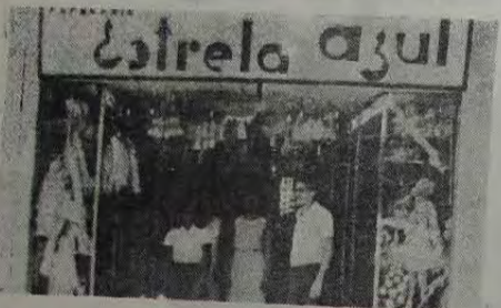
Papelaria Estrela Azul Rua Mal. Floriano Peixoto, 2184

Associando-se às comemorações da Data Magna da Cristianidade desejamos aos nossos distintos fregueses e amigos os melhores votos de FELIZ NATAL e próspero ANO NOVO