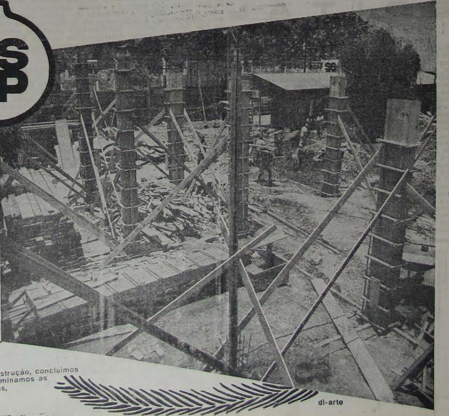
Em apenas 3 meses de construção, concluímos o serviço de terraplanagem, terminamos as fundações e já erguemos as colunas, preparando-nos agora para concretar parte da 1ª laje. dl-arto