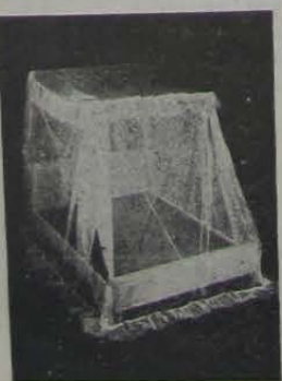
DIXIE de noite