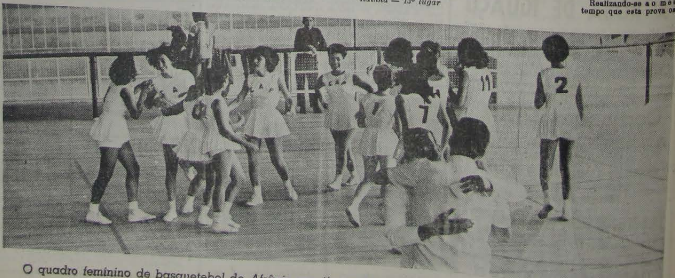
O quadro feminino de basquetebol do Afrânio manifestando sua alegria, após classificar-se em 4º lugar