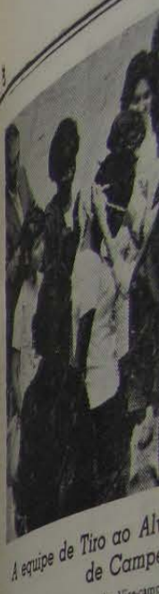
A equipe de Tiro ao Alvo de Campeão