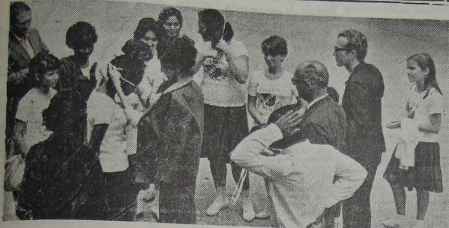
A equipe de Tiro ao Alvo do Afrânio, recebendo as medalhas de ouro de Campeã dos XVI Jogos da Primavera

Ginástica-ecleziástica do Ministério da Educação entre os municípios de Nova Iguaçu, São João de Meriti, Caxias e Nilópolis, a equipe do Afrânio teve que se dividir a fim de corresponder aos dois compromissos. Mesmo assim a 4ª colocação lhe ficou assegurada na seguinte final: