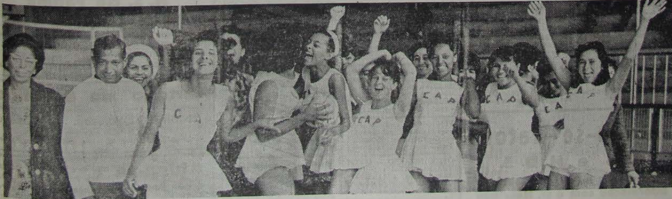
A foto mostra a alegria da equipe de vólibol do Colégio Afrânio Peixoto, uma das cinco que conquistaram o Vice-Campeonato nos XVI Jogos da Primavera (Na quarta e quinta páginas, o leitor encontrará ampla reportagem ilustrada, contando os feitos surpreendentes dos colegiais Iguassuenses)