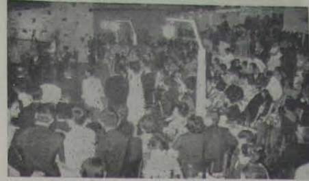
Um aspecto do baile das debutantes, festa que reuniu o mundo social iguassuano, sábado último, no tradicional e querido clube alvi-negro

Numa linda e concorrida festa, que atraiu as atenções da sociedade iguassuana, realizou o E. C. Iguassú o seu 1º baile das debutantes.