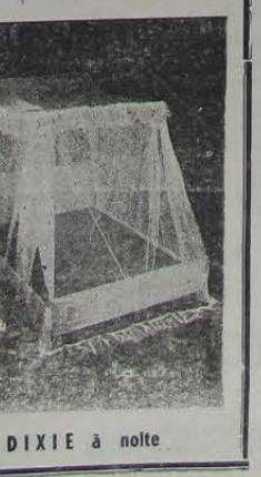
DIXIE à noite