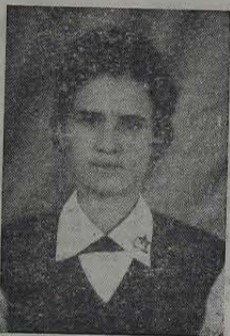
Rainha da Simpatia