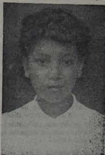
Campeã Olímpica: Voleibol, Iguassubol, basquetebol, velocidade, revezamento e pingue-pongue