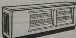
BALÇÃO-FRIGORÍFICO C/ CABINE

TUDO PARA REFRIGERAÇÃO COMERCIAL E INDUSTRIAL