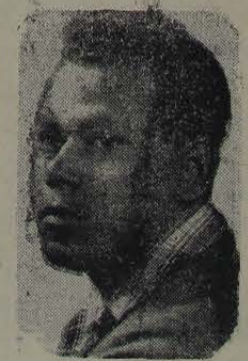
dos bons da Sollimões. Breve gravará duas melodias, um rojão e um baão. Salve ele!